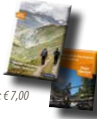
Kombi: € 7,00

Unsere Wander- & Radkarte: Holen Sie sich unsere detaillierte Wander- und Radkarte inklusive Begleitheft mit vielen Wandervorschlägen im Infobüro.