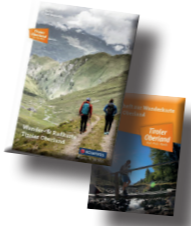
Kombi € 7,00

UNSERE WANDER- & RADKARTE Holen Sie sich unsere detaillierte Wander- und Radkarte inklusive Begleitheft mit vielen Wandervorschlägen im Infobüro.